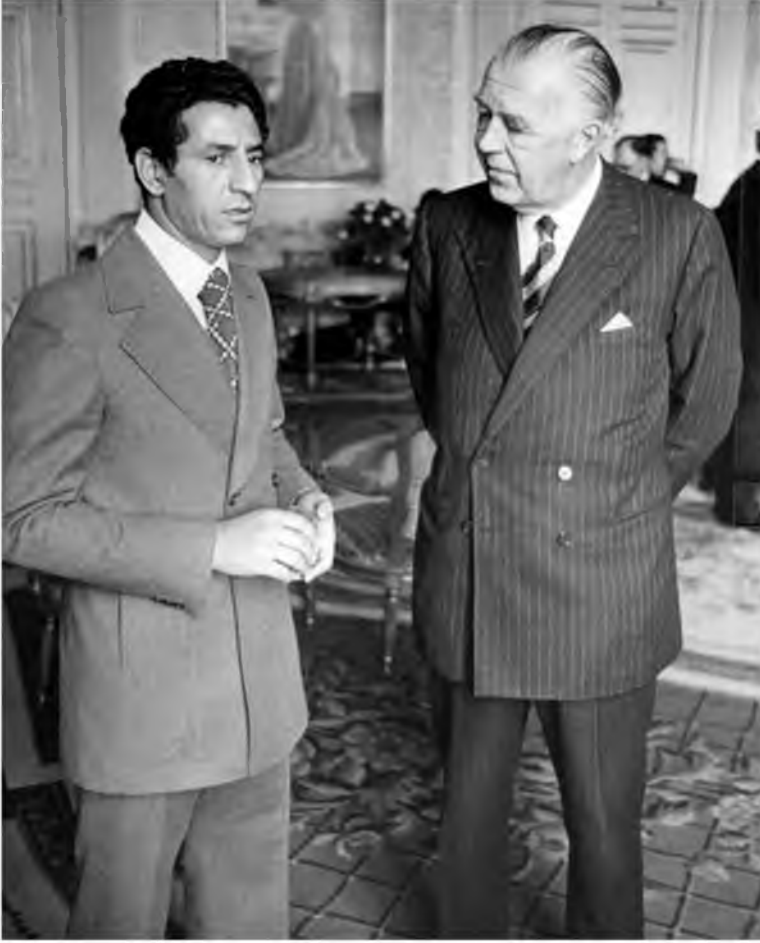
جانب من محادثات بين رئيس الوزراء الليبي عبد السلام جلود مع الأمير بيرتل غوستاف أوسكار كارل يوجين بالقصر الملكي في ستوكهولم، السويد، 1974 / 3 / 1.